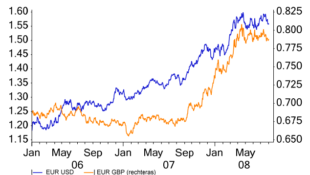
Grafiek 2: Wisselkoersen